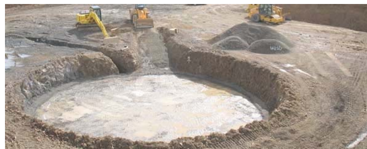
Selon l'étude d'impact de SNC-Lavalin Environnement Inc., 2008, commandée par le promoteur Enerfin, (pages 46-47) chaque fondation d'éolienne nécessitera de 400 à 450 m 3 de béton, soit environ 45 bétonnières; l'excavation de la fondation se fera à la pelle mécanique avec marteau perceur et dynamitage pour creuser une surface de 56 pieds par 56 pieds. Le site d'implantation de chaque éolienne, accueillant les grues nécessaires à la mise en place des structures, aura une surface maximale de 6400 m 2 (soit 264 pieds par 264 pieds) qui devra être déboisée et nivelée au boteur.