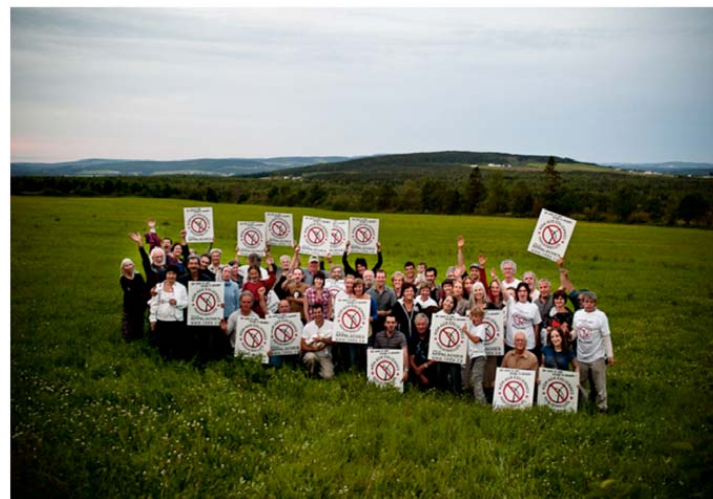
Une cinquantaine de sympathisants du RDDA posent à Vianney devant les montagnes et vallées dont ils entendent préserver l'intégrité et la beauté pour les générations présentes et futures.